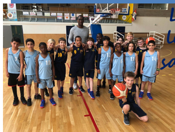
Le U11 C et leurs adversaires du jour