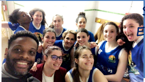
Seniors filles 2 En route pour le titre

Merci aux parents et supporters présents qui ont dû apprécier!!!