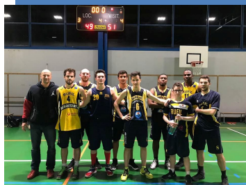
Les seniors C Victorieux À Nanterre